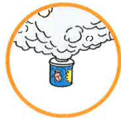
くん煙式殺虫剤など