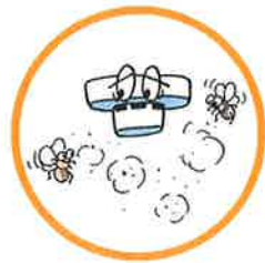
ホコリや小さな虫