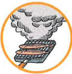
調理時の煙や湯気